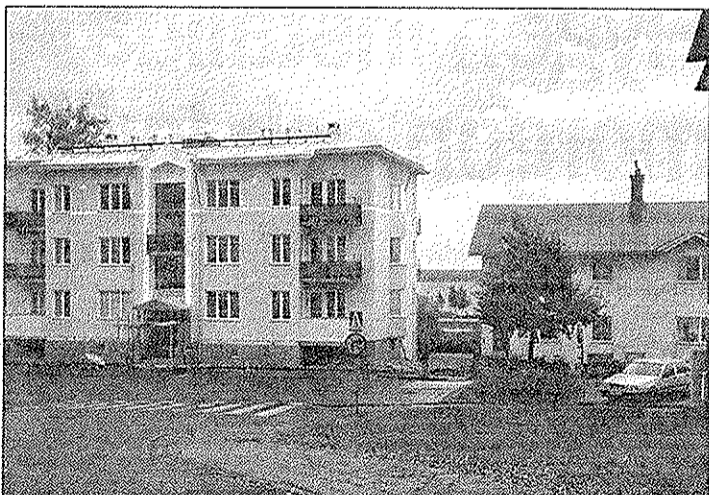
Huset smälter väl in i miljön.