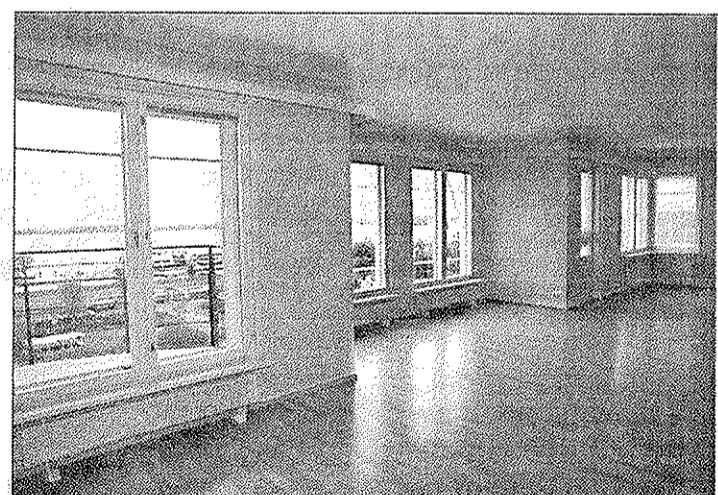
I den här lägenheten finns det tre rum i ett - längst till höger är det bibliotek, i mitten vardagsrum och till vänster matsal.