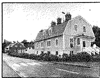
Ett av stadens vackraste hus, frestas man utbrista när man ser det upprustade trähuset vid Parkgatan 24.