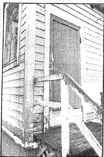
Trots det bedrövliga utseendet så är huset i gott skick, det märktes vid renoveringen. Inte mycket var ruttet under ytan.

Huset är mörkare gult än tidigare. Taket ska målas i en mörkröd nyans. Sockeln